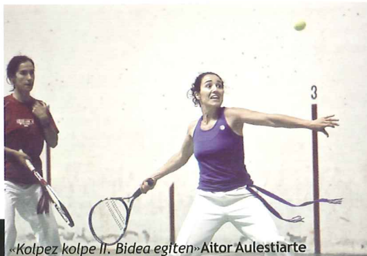
«Kolpez kolpe II. Bidea egiten» Aitor Aulestiarte